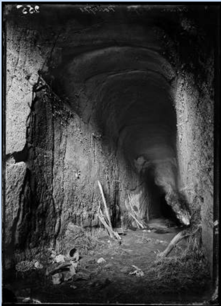
Η σπηλιά του κύκλωπα Πολύφημου, στο Ποσίλυπο της Νάπολης