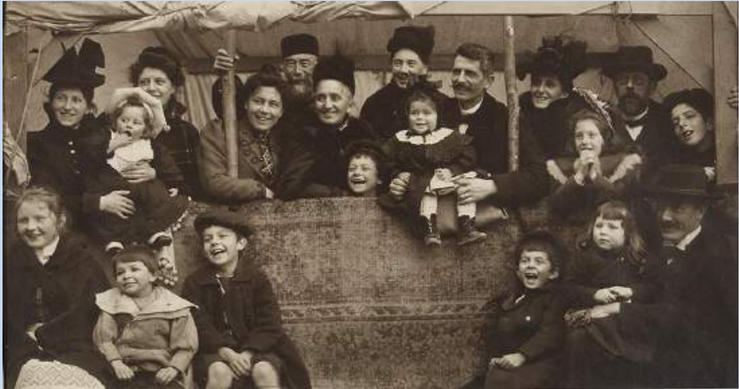
Στο θέατρο Γκινιόλ, 1900

Ο Μπουασονά ζητά από την Ωγκύστα και τα παιδιά τους να ποζάρουν για τις φωτογραφίες του.