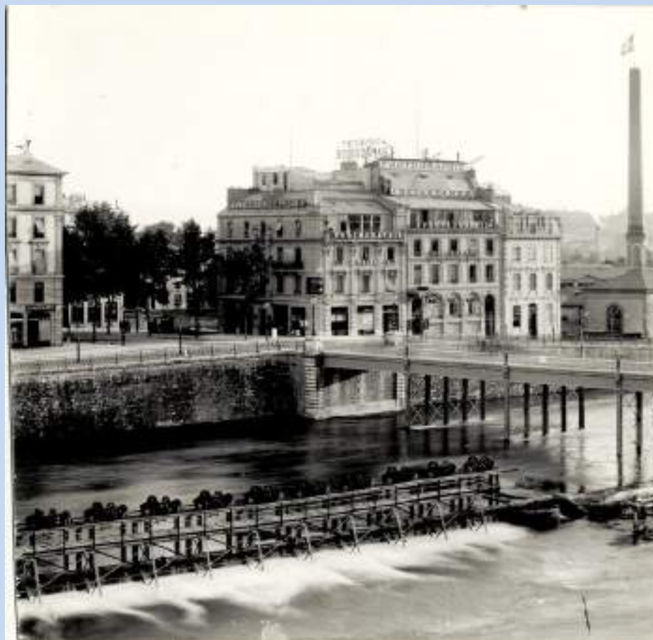
Το φωτογραφικό στούντιο Μπουασονά στη Γενεύη, 1885