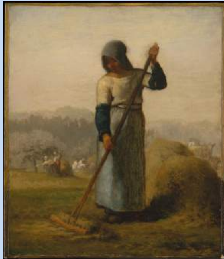
Ζαν Φρανσουά Μιγιέ, Γυναίκα με τσουγκράνα , 1856-57