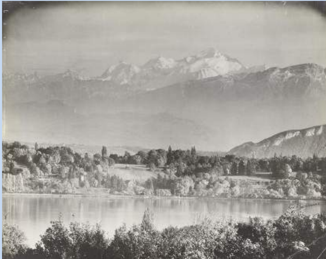
Το Λευκό Όρος, 1892

«Θέλω να κάνετε στον Παρνασσό αυτό που κάνατε και στο Λευκό Όρος»