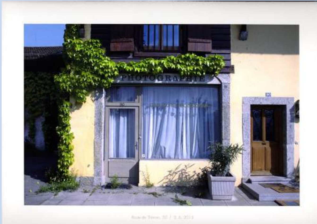
Το τελευταίο στούντιο Μπουασονά στη Γενεύη