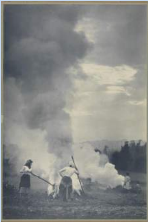
Φρεντ Μπουασονά, Το φθινόπωρο , 1899

Τι όμορφη φωτογραφία! Μοιάζει με ζωγραφιά!