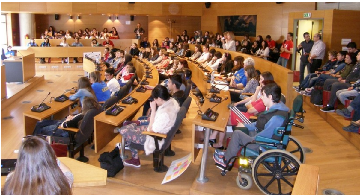
Από τις εργασίες του μαθητικού συνεδρίου στην αίθουσα του Δημοτικού Συμβουλίου, 2015

Στο τέλος της σχολικής χρονιάς διοργανώνεται μια κεντρική εκδήλωση με στόχο τόσο την προβολή των εργασιών των σχολικών ομάδων όσο και τη συνάντηση μαθητών από τα σχολεία του δικτύου και τη συνδιαμόρφωση μέσα από συνεργατικές διαδικασίες των προτάσεών τους για πιο βιώσιμες πόλεις. Η εκδήλωση έχει τη μορφή μαθητικού συνεδρίου και για την υλοποίησή της επιδιώκεται η συνεργασία της Τοπικής Αυτοδιοίκησης. Το ΚΠΕ μαθητικά συνέδρια πραγματοποιήθηκαν στους χώρους του Δημαρχιακού Μεγάρου Θεσσαλονίκης.